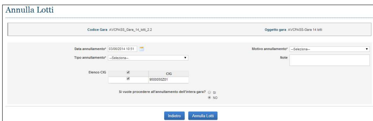
Figura 4 - Annulla Lotti

L'utente accede ad "Annulla lotti" premendo l'apposito pulsante, dopo aver selezionato uno o più CIG.