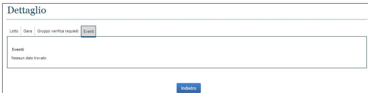
Figura 9 - TAB Eventi