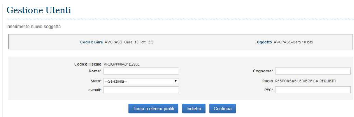
Figura 15 - Inserimento Componente in Anagrafica

Per inserire i dati del soggetto da inserire in anagrafica è necessario compilare la schermata "Inserimento nuovo soggetto", dove tutti i campi sono obbligatori.