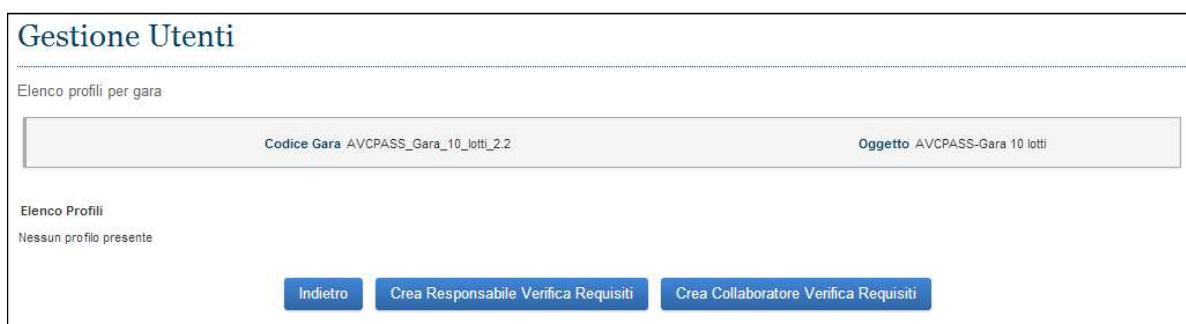
Figura 10 - Gestione Utenti

Per quanto concerne il Collaboratore, le attività saranno limitate a funzioni di verifica.